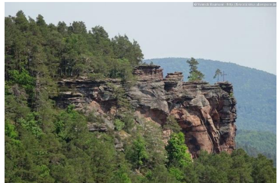
Aussicht vom Kieungerfels auf den Rötzenfels

Wir laufen zurück zum Abzweig Rötzenfels und folgen halbrechts dem Pfad (Markierung Dimbacher Buntsandstein Höhenweg (Felssilhouette über roter Welle) ) den Hang hinab. An der Haarnadelkurve eines Forstweges halten wir uns rechts und biegen kurz danach scharf rechts auf einen weiteren Forstweg ab. Der markierte Weg biegt dann links ab, wir verbleiben aber auf dem Forstweg und können an der nächsten Haarnadelkurve den Rötzenfels von unten sehen. Wir biegen an besagter Kurve links und kurz darauf scharf rechts ab.