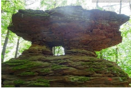
Buntsandsteinfelsen auf dem Immersberg

erreichbar ist. Von hier können wir die imposante Felswand des Rötzenfelsens vor uns sehen.