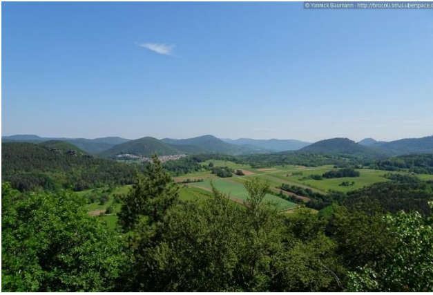
Aussicht vom Dimbergfels nach Nordosten

Es geht den gleichen Weg zurück zum Abzweig Dimberg und links hinab. Wir folgen dem Pfad mit der Markierung Dimbacher Buntsandstein Höhenweg (Felssilhouette über roter Welle) und biegen links auf einen Erdweg ab. An einer Abzweigung halten wir uns links und können kurz danach den Dimbergpfeiler von unten bestaunen.