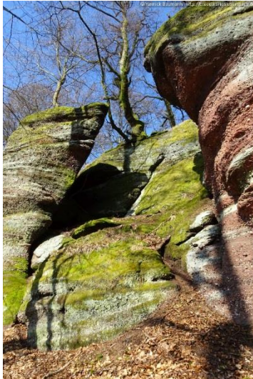
Entlang des Felsenpfades

Rad- und Autofahrer dürfen ausschließlich die ausgewiesenen Forststraßen benutzen (RF du Maibaechel, RF du Hunebourg, RF de Johannisthal, RF du Fischbaechel zwischen Loosthal und Johannisthal sowie die Zufahrtsstraße von der D 134 nach Fuellengarten und zur Burg Hunebourg).