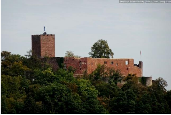
Aussicht vom Hatzelberg auf die Burg Landeck

Wir folgen unserem Wanderweg und können nach einer Weile auf der rechten Seite eine Aussicht zu den Burgen Trifels und Anebos genießen. Kurz vor dem Karlsplatz halten wir uns an der Gabelung links (rechts geht es zur Karlsplatzhütte) und erreichen den weitläufigen Karlsplatz (1) .