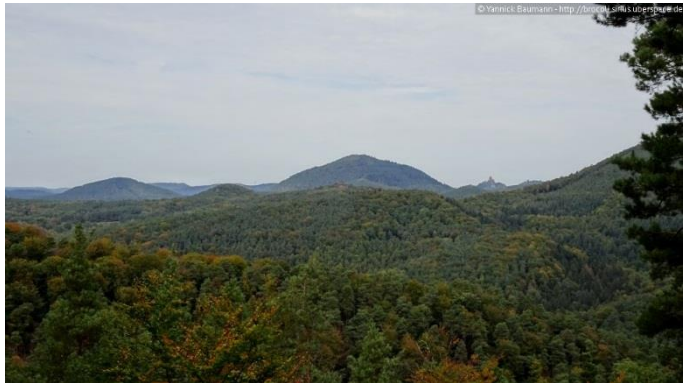
Aussicht auf den Rehberg und die Burgen Trifels und Anebos

Wir folgen weiterhin der Markierung Schwarzer Punkt auf weißem Balken und überqueren eine Straße. Der Weg wird nun etwas steiler und an einer Gabelung halten wir uns links (Zum Turm) und gehen den kurzen Abstecher zum Aussichtsturm von Bad Bergzabern (3) (Bismarckturm). Von oben können wir eine schöne Aussicht auf die Rheinebene und den Pfälzerwald genießen.