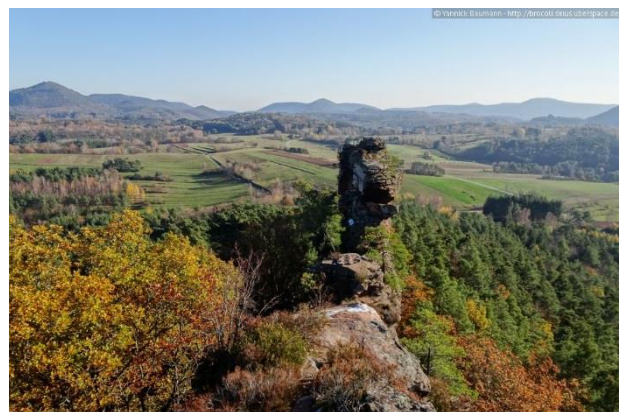
Auf den Geiersteinen

Nach einer Weile erreichen wir den Bergrücken und können nun ein wenig verschnauften. Der Weg führt uns durch schattigen Wald zunächst an den Katzenfelsen und anschließend am Mausfelsen vorbei. Schon kurz darauf gelangen wir zum "Abzweig Geiersteine", an dem wir geradeaus weitergehen, um zu den Geiersteinen (2) zu kommen. Von hier können wir eine schöne Aussicht von Süden bis Nordosten und auf die Burgen Neuscharfeneck, Trifels und Madenburg genießen.